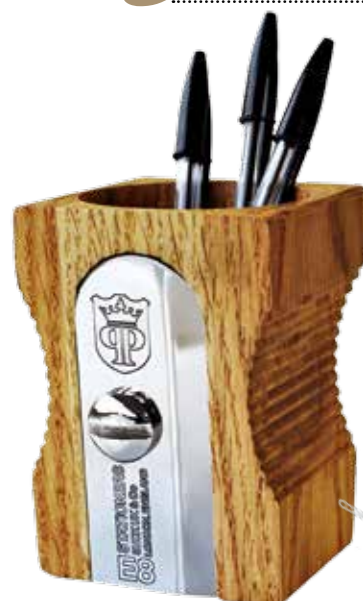
Pojemnik na biurko Suck UK, ploners.pl