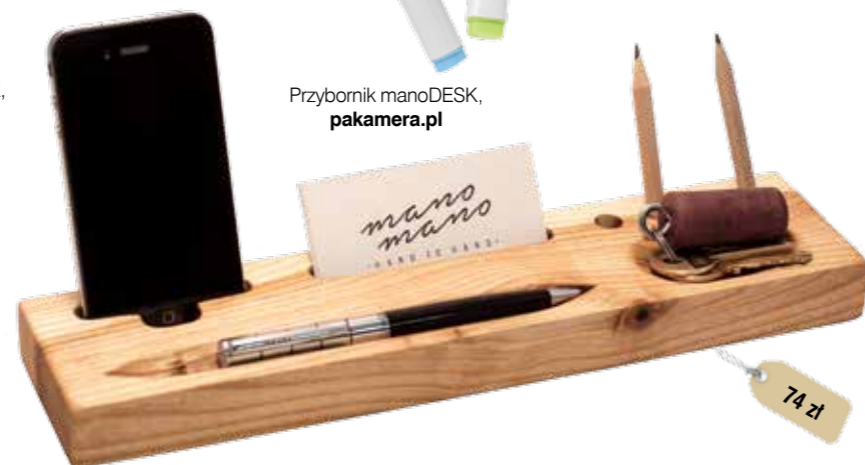
Przyborek manoDESK, pakamera.pl